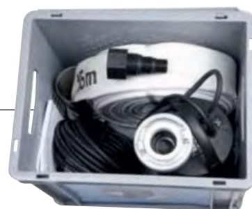
Grundfos Multibox B-CC7